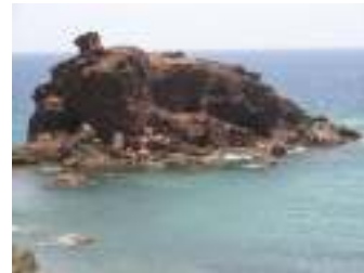
Fotos de las playas de El Burrero y San Agustín (Ingenio)

Para más información puede dirigirse al autor de estas descripciones cuyo e-mail es: alvaromonzon@gmail.com