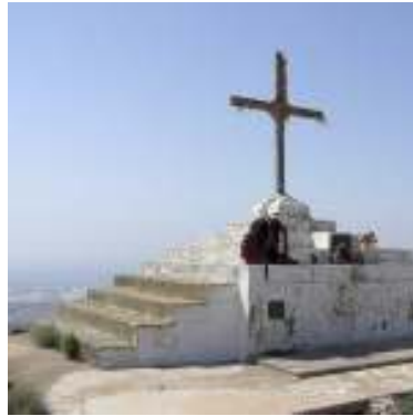
Cruz de la Montaña de Agüimes