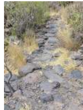
Restos del empedrado histórico del camino de bajada a La Banda

Descenderemos por la calle hacia el campo de fútbol y el fondo del barranco. Una vez en el cauce del barranco de Guayadeque (enfrente tiene el Bar la Petanca y su popular juego) caminamos aguas abajo por un tramo de carreterita hasta las proximidades de la carretera general del sur. Antes de llegar al túnel, bajamos a la derecha para pasar por debajo de la carretera. Cogemos la boca de la derecha porque a su salida existe un leve sendero que se abre paso hasta la siguiente pista de tierra por la que avanzamos.