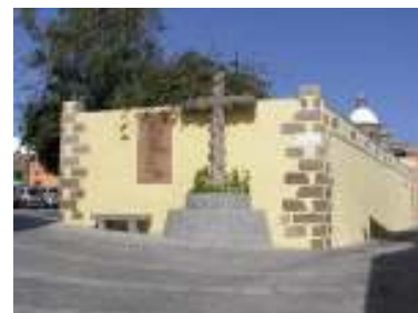
"Las Cuatro Esquinas" - Casco Histórico de Agüimes

Después la calle Taburiente, y ya enfilamos la pista de tierra con una señal indicadora de entrada a un espacio natural protegido.