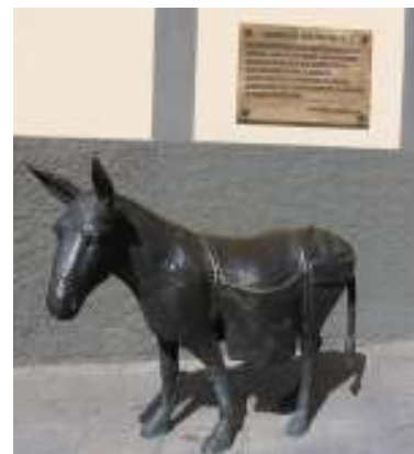
Memoria de nuestra Villa