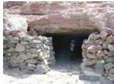
Entrada a una de las cuevas aborígenes