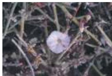
Foto del Chaparro (Convolvulus caput-medusae), endemismo canario

Caminamos rumbo E por la calle Nuestra Señora del Carmen hasta unas escaleras a la derecha, calle Baífo, y después a la izquierda para pasar por delante de la plaza del pueblo (cabina de teléfono-tienda de víveres).