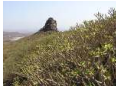
Morro del Cuervo y tabaibas dulces

La montaña es un edificio levantado en el primer episodio volcánico, hace aproximadamente unos 13 millones de años. Sus materiales sedimentarios están constituidos principalmente por basaltos con afloramientos de ignimbritas en su parte noroccidental y está declarada por el parlamento de Canarias como Paisaje Protegido de Montaña de Agüimes.